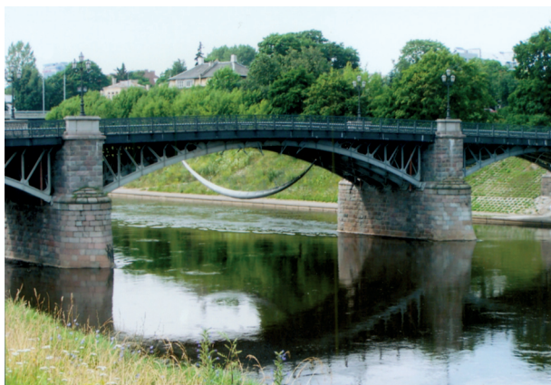
12 pav. Metalo kompozicija po Žvėryno tiltu, K. Vildžiūnas. Vilnius, 2010m.