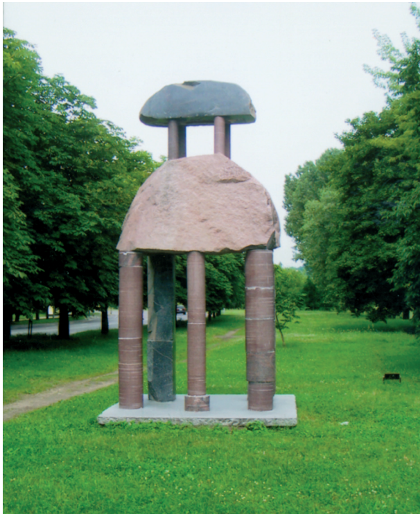
8 pav. Skulptūra „Dviaukštis“ šalia Mokslininkų namų, M. Navakas. Vilnius, 2009 m.

Skulptorius Kunotas Vildžiūnas, įgyvendindamas projektą „Vilniaus ženklai“ (2010 m.), sukūrė efektingas plastikos kompozicijas pateikiamas jas neįprastose vietose – po Vilniaus tiltais. Autorius skulptūras bandė derinti prie tiltų formos, dydžio bei proporcijų. „Karališkasis obuolys“ – sidabrinis rutulys, pakibęs tarp Antakalnio tilto konstrukcijų ir upės, atsispindi jos vandens veidrodyje (10 pav.). Harmoningai dera su