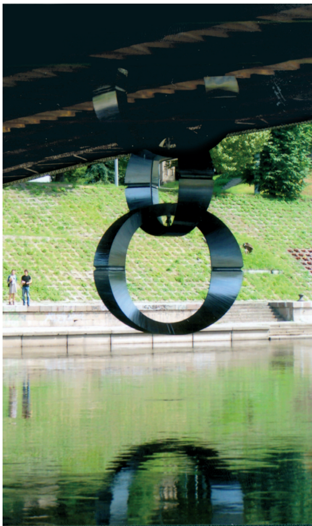
11 pav. Metalo žiedų kompozicija po Žaliuoju tiltu, K. Vildžiūnas. Vilnius, 2010 m.