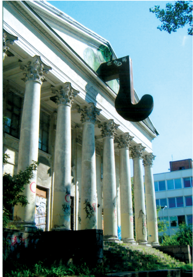
6 pav. Skulptūra „Kablų“ buvusių Geležinkelininkų kultūros namų fasade, M. Navakas. Vilnius, 1994 m.

M. Navakas skulptūrai „Dviaukštis“ pasirinko neįprastą vietą – nuošalią erdvę Neries krantinėje, netoli vadinamųjų Mokslininkų namų. Kompozicija sudėliota iš granito gabalų (primenantį Orvydų sodybos akmens skulptūras), archajinėmis architektūrinėmis formomis sarkastiškai kontrastuoja su netoliese esan-