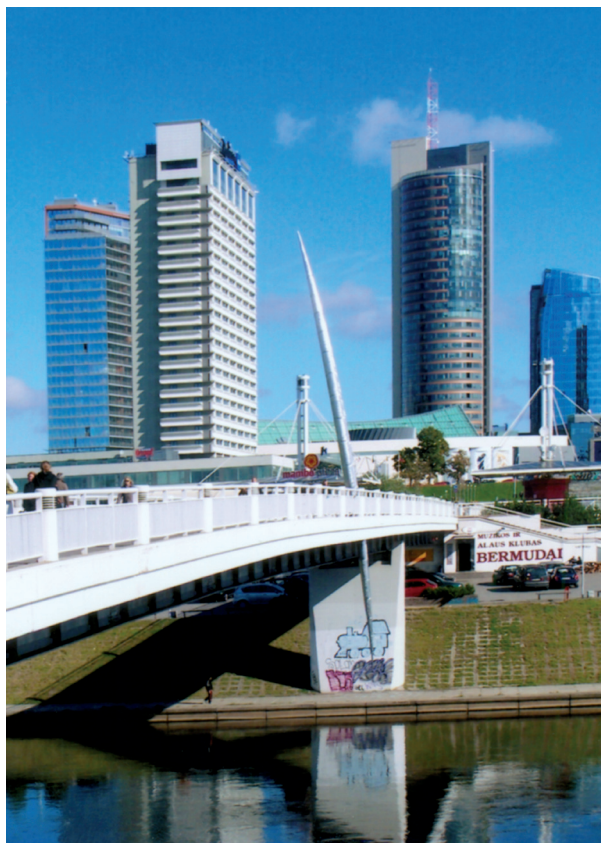
13 pav. Skulptūra „Spindulys-ietis“ ant Baltojo tilto. K. Vildžiūnas. Vilnius, 2010 m.