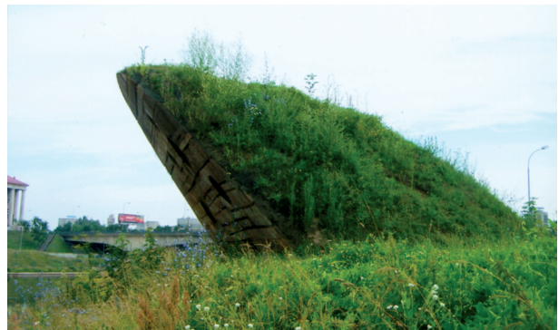
7 pav. Kompozicija „Puskalnis“ Neries krantinėje, R. Antinis. Vilnius, 2009 m.

Fig. 6. Sculpture „Kablų“ (“Hook”) on the facade of the former Railroader Recreation Center in Vilnius, M. Navakas, 1994