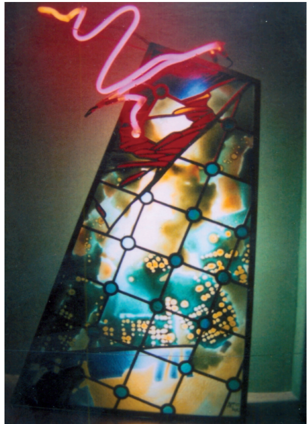
4 pav. Vitražinis stiklo objektas „Svaigulys“ restorane „Liepų pavėsis“, A. Macevičius. Kaunas, 1995 m.

Fig. 3. Three-dimensional stained-glass „Atspindžiai“ („Reflections“) above the swimming pool in Druskininkai. G. Dumčius, arch. V. Gilius, 1998