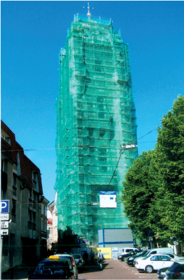
14 pav. Instaliacija „Apvilktas objektas“ – Šv. Jonų bažnyčios bokštas (rekonstrukcijos metu). Vilnius, 2010 m.