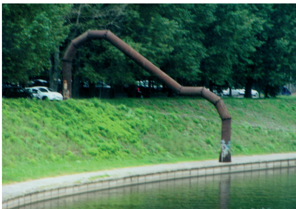
9 pav. Skulptūra „Krantinės arka“ Neries krantinėje, V. Urbanavičius. Vilnius, 2009 m.

Fig. 8. Sculpture „Dviaukštis“ (“Two-storey”) next to the Scientists' Palace in Vilnius, M. Navakas, 2009