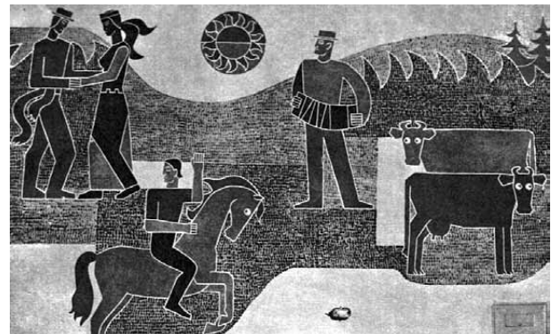
6 pav. Duokiškio (Rokiškio raj.) kultūros namų dekoratyvinis pano, dail. V. Gurskis, 1974 m.

Fig. 5. House of Culture in „K. Požėla“ collective farm (now Kaltinėnai?), Šilalė region, 1968