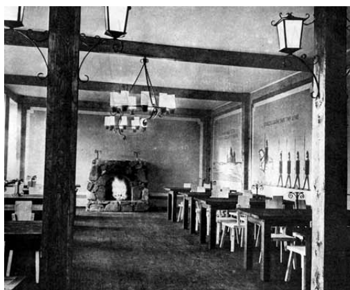
4 pav. Kapsuko (dab. Marijampolės) rajono, „Naujo gyvenimo“ kolūkio (dab. Iglisškėlių) kultūros namų svetainė, arch. J. Butkevičius, 1971 m.