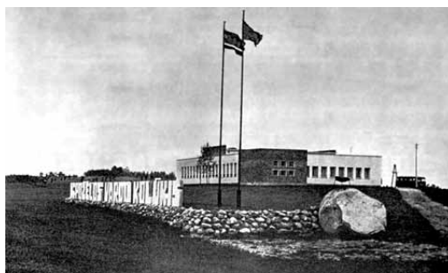
3 pav. Netičkampo kultūros namai, 1968 m.