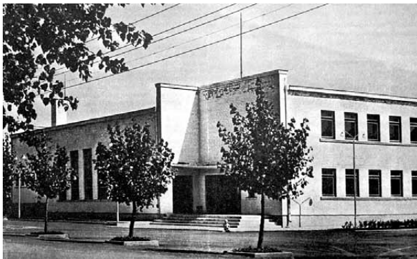
5 pav. Šilalės raj. K. Požėlos kolūkio (dab. Kaltinėnai?) kultūros namai, 1968 m.

Fig. 5. House of Culture in „K. Požėla“ collective farm (now Kaltinėnai?), Šilalė region, 1968