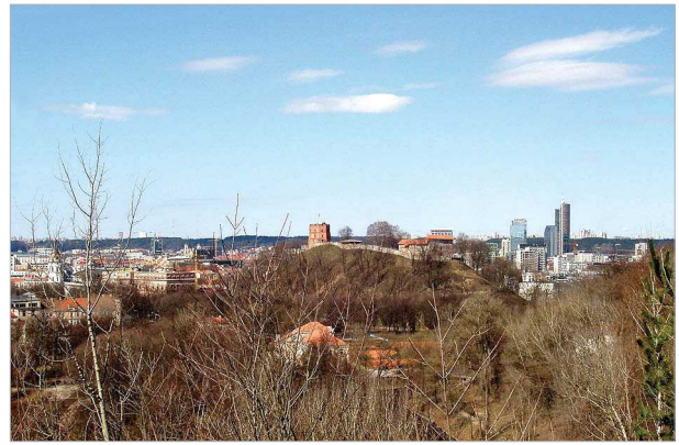
7 pav. Charakteringa Vilniaus miesto centro panorama nuo neįrengtos, pagal miesto Bendrąjį planą numatytos, apžvalgos vietos Užupyje

Fig. 6. Buildings on Žygimantu street at the Green bridge; the problematic site of Vilnius Old Town (the left bank of the River Neris)