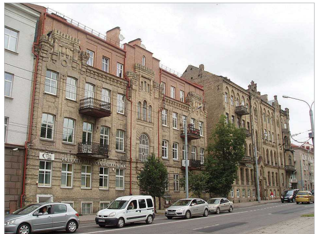
Fig. 1. Vilnius city center “Architectural Hill”, Konstitucijos avenue (the right bank of the River Neris)