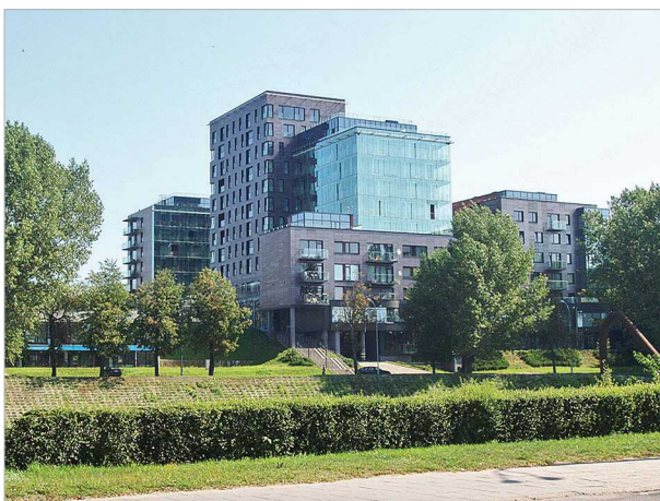
4 pav. Žvejų gatvės naujas stambiatūris užstatymas tarp Karaliaus Mindaugo ir Žaliojo tiltų (dešinysis Neries krantas priešais Senamiestį)

Autoriaus nuomone, aptariant upės kairiosios ir dešinėsios pusių užstatymą, dabar aktualiausia yra dešinioji upės pusė, tai yra užstatymas tarp Karaliaus Mindaugo ir Žaliojo tiltų. Šioje atkarpoje, kuri yra prie- šais Senamiesčio Žygimantų gatvės užstatymą, galimo naujo užstatymo tūriai bei panoramos yra labai aktua- lios. Čia jau dabar matome per didelės apimties naujo užstatymo konkurenciją su aplinka: ties Architektų sąjungos pastatu ir „Lietuvos energija“ (4 pav.). Net kelių medžių pašalinimas priešais Architektų sąjun- gos pastatą-pilaitę padėtų atidengti šį architektūros paminklą (5 pav.).