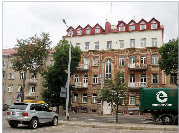
2, 3 pav. Pamėnkalnio gatvės pastatų aukštinimo svarstyti pavyzdžiai

Figs 2–3. Discussable examples of elevation buildings on Pamėnkalnio street